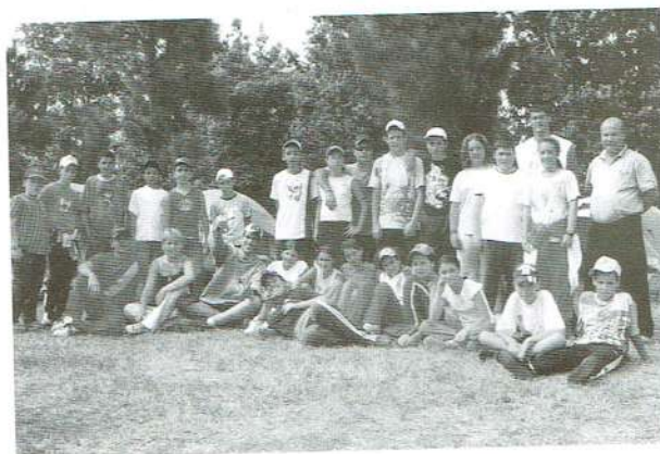
Grupo de jugadores y técnicos que asistieron a uno de los actos organizados por la Escuela. El campamento en La Laguna en Junio de 2006

En próximos números os ampliaremos la información sobre nuestra cantera