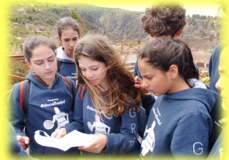
Educabasket 9 visitó el Molino de las Tricias, el conjunto arqueológico de Buracas, observó estrellas y planeta con telescopio, realizó actividades educativas, de ocio y senderismo. Un paquete de actividades muy completo.