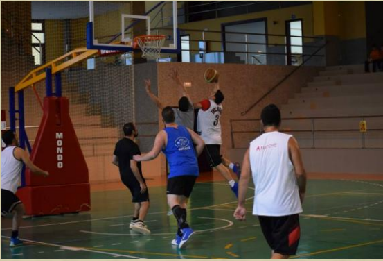
Los Tontúpidos ganaron todos sus partidos pero se retiraron en semis