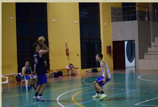
ELLA fue justo campeón, Los Saucés Lakers, la sorpresa del torneo.