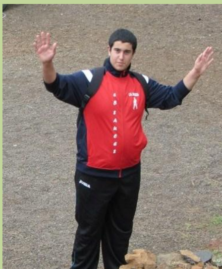
“Algún día me gustaría ser entrenador”