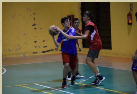
La categoría junior fue disputada y el balón hizo campeón a Los Plátanos