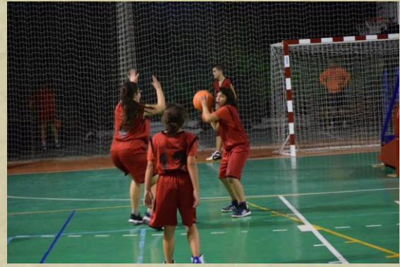
Las chicas dieron espectáculo