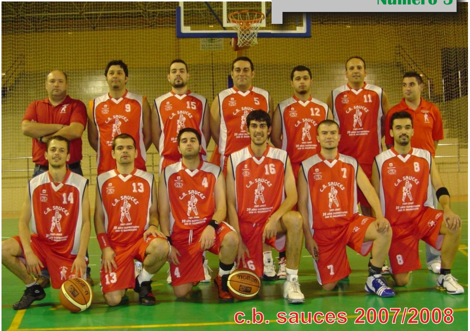
c.b. sauces 2007/2008